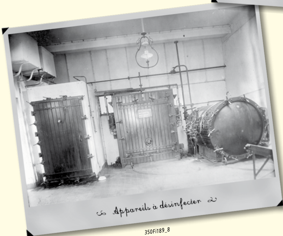
☞ Appareils à désinfecter ☜