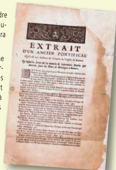
Document consolidé par colmatage (greffe mécanique de pâte à papier)

La restauration demandée a consisté essentiellement en un nettoyage léger des documents et à leur mise à plat afin de faciliter leur manipulation et leur lisibilité pour la numérisation. Quelques opérations de consolidations partielles ont été également nécessaires.