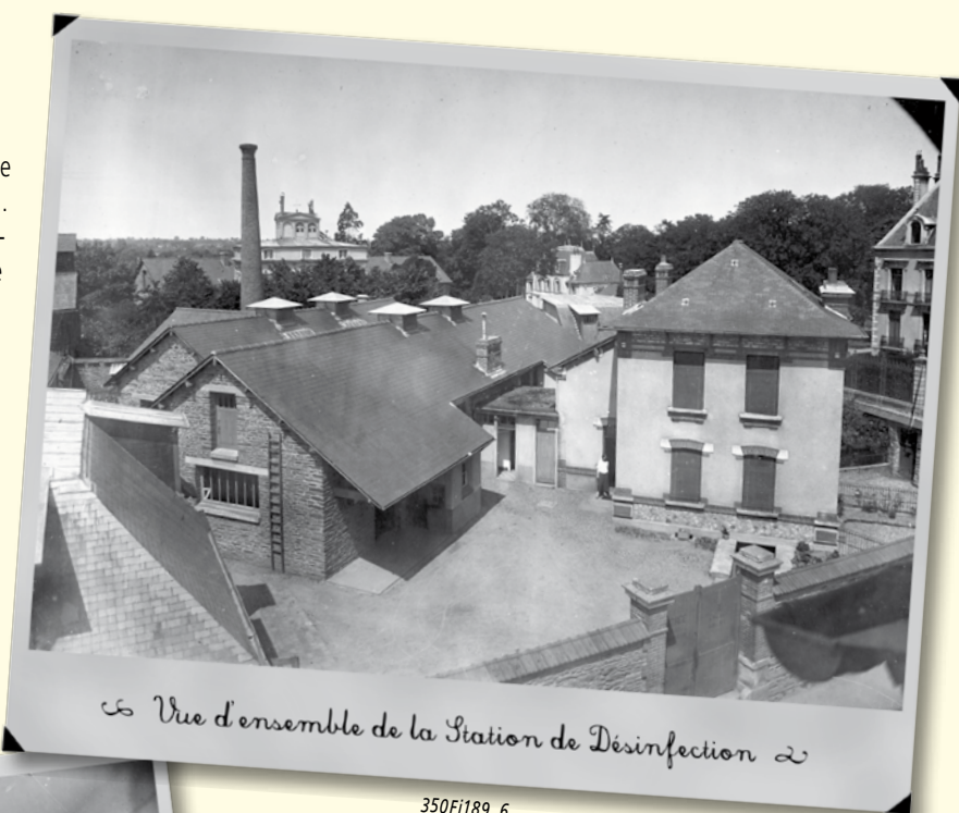
☞ Vue d'ensemble de la Station de Désinfection ☜

Dans le dernier Archinews, la photographie représentait une vue d'ensemble de la station de désinfection autour des années 1920. Dès 1908, le Dr Bodin, alors directeur du Bureau d'hygiène et professeur de bactériologie de l'Ecole de Médecine et de Pharmacie souhaite réorganiser le service municipal de Désinfection. Sur un terrain cédé gratuitement à la ville par la Commission des Hospices civils en 1910 (en échange de quoi cette dernière s'engageait à opérer gratuitement la désinfection du linge et de la literie provenant de l'Hôtel-Dieu), la ville fait alors construire ces bâtiments et la station est mise en marche le 1 er janvier 1914 « de façon à ce que l'on puisse chaque jour y envoyer les objets contaminés et qu'elle puisse les rendre après stérilisation dans le plus bref délais ».