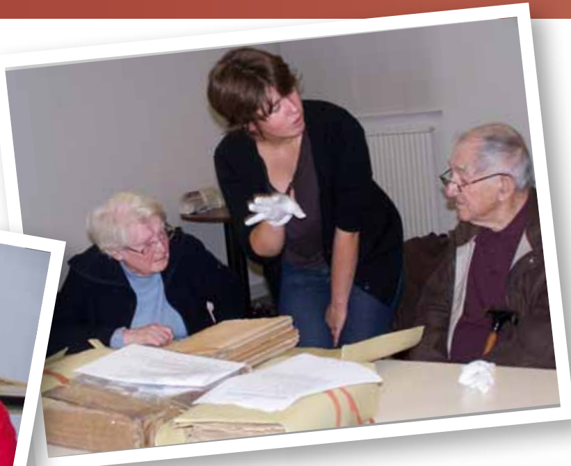
Séances de travail sur les archives du quartier Centre.